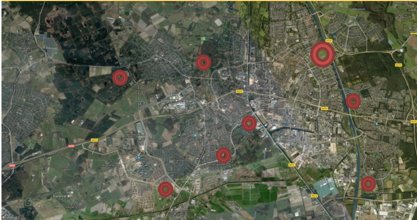
De sportparken met voetbal

Helmond kent een 8-tal sportparken waar veldvoetbal plaatsvindt. Deze sportparken liggen goed verspreid over de stad. De meeste verenigingen hebben een eigen sportpark. Voor de Braak en Brandevoort is die situatie anders. Op sportpark De Braak zijn drie voetbalverenigingen gehuisvest, op Sportpark Brandevoort huurt de voetbalvereniging van de Stichting Sporten en Bewegen Brandevoort. Op dit moment is er slechts bij twee sportparken sprake van ondercapaciteit (teveel teams voor de beschikbare velden): Brandevoort en Molenven. Overall gezien zijn er teveel voetbalvelden in Helmond.