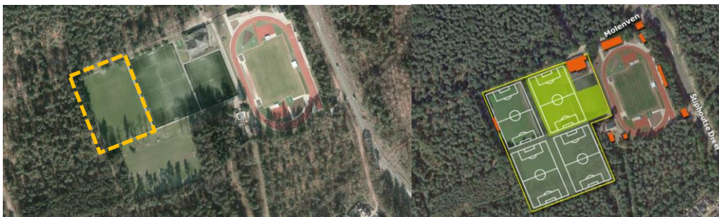
Sportpark Molenven, mogelijke locatie kunstgras Sportpark Molenven; positionering extra veld

Voorgesteld wordt in overleg met de vereniging Stiphout Vooruit de verschillende alternatieven te bespreken.